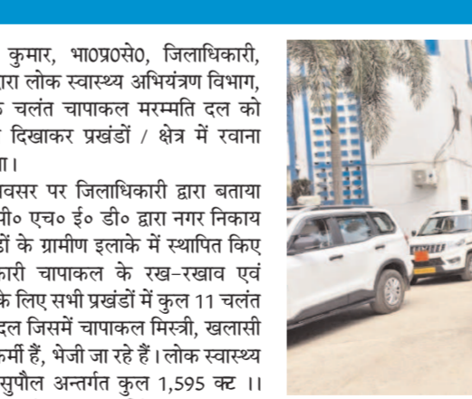
जिलाधिकारी मरम्मत दल को हरी झंडी दिखाकर रवाना करते हुए